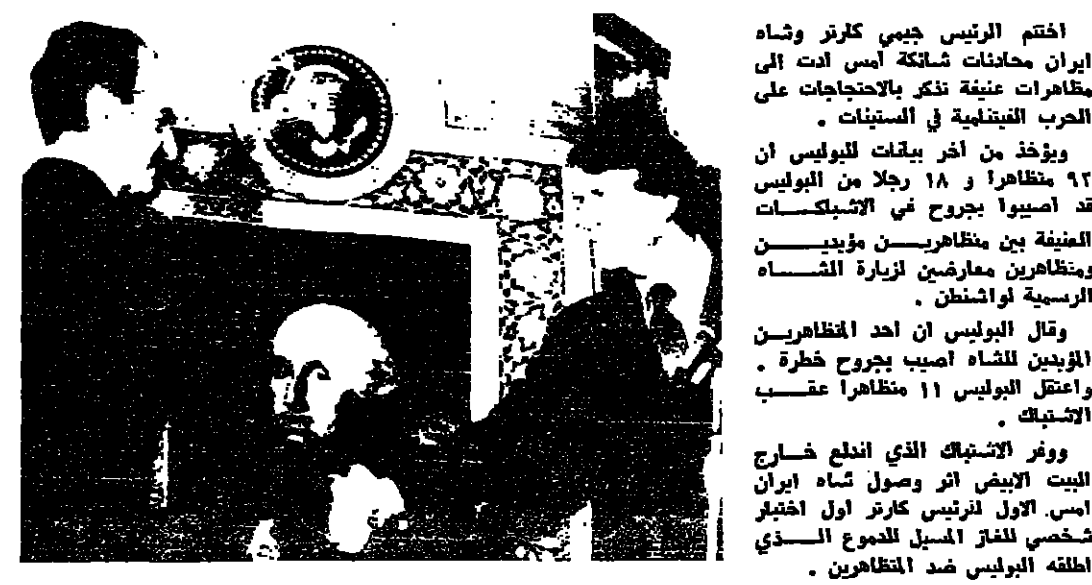
كارتر يرحب بالشاه

اختتم الرئيس جيمي كارتر وشاه إيران محادثات شائكة أمس أدت إلى مظاهرات عنيفة تذكر بالاحتجاجات على الحرب الفيتنامية في الستينات. ويؤخذ من آخر بيانات البوليس أن ٩٢ متظاهرا و ١٨ رجلا من البوليس قد أصيبوا بجروح في الاشتباكات العنيفة بين متظاهرين مؤيدين للشاه وبين ضباط البوليس الذين كانوا يراقبون مسيرة المتظاهرين. وقال البوليس إن أحد المتظاهرين المؤيدين للشاه أصيب بجروح خطيرة واعتقل البوليس ١١ متظاهرا عقب الاشتباك. ووفق الاشتباكات الذي اندلع خارج البيت الأبيض إثر وصول شاه إيران إلى البلاد، فقد أصيب عدد من المتظاهرين بجروح خطيرة، واعتقل عدد من المتظاهرين. وقال البوليس إن عدد الجرحى في الاشتباكات بين المتظاهرين وبين البوليس قد ارتفع إلى ١١ جرحى، و١٨ من المتظاهرين قد اعتقلوا. وقال البوليس إن عدد الجرحى في الاشتباكات بين المتظاهرين وبين البوليس قد ارتفع إلى ١١ جرحى، و١٨ من المتظاهرين قد اعتقلوا.